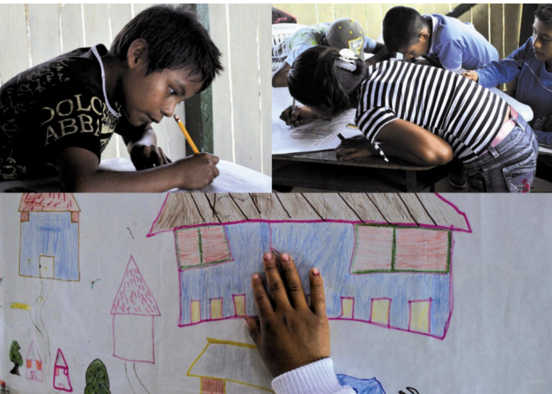
Imagen 7. Talleres nuestro territorio

talleres que permitieron conocer los sueños y expectativas de los niños en torno a la casa y su relación con la vivienda que habitan en la actualidad. (Arbeláez S. L. 2012)