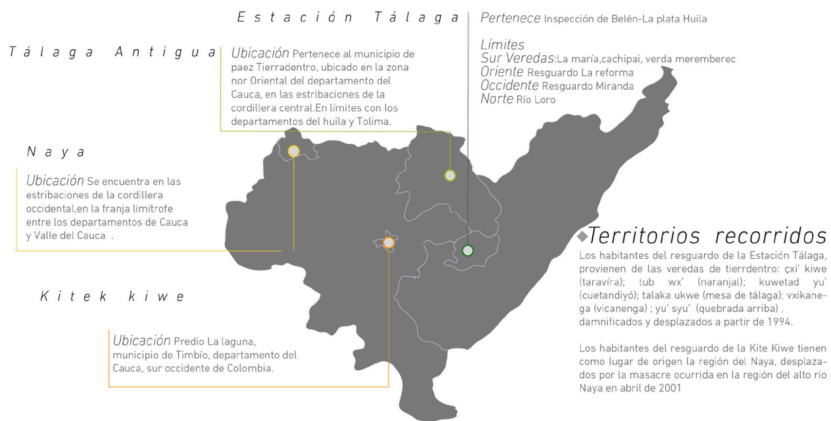
Imagen 5. Caminos del proyecto

En principio el acercamiento 2 se dio a través del diálogo y la convivencia en campo, recolectando información desde la IAP (Investigación Acción Participativa), que si bien, ha sido eje en las ciencias sociales y las humanidades para la formulación de un problema de investigación, aquí se resignificó desde la perspectiva del sujeto y el espacio habitado, tratando de tejer el conocimiento centrado en la academia con una relación más armónica que involucra realidades territoriales y vivencias de la gente.