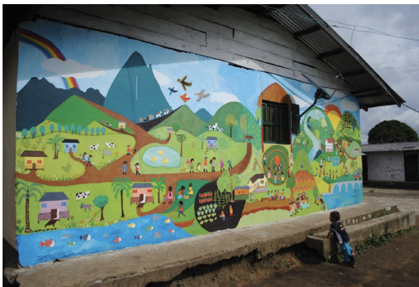
Imagen 9. Nuestro plan de vida. Construido con la comunidad de Kitek Kiwe