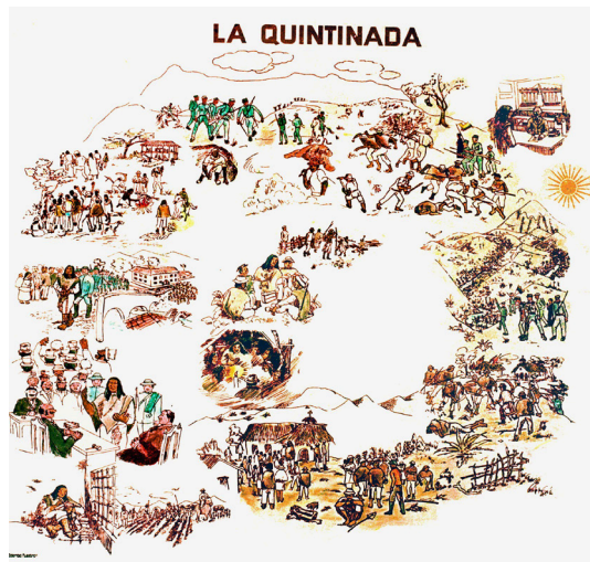
Imagen 3. Mapa parlante - La Quintinada

Desde las múltiples territorialidades (no es una realidad imaginada), es concebida y representada de diversas maneras. Su forma no está en directa relación con el contenido, la constituyen los avatares que se tejen, construyen, transforman y se resignifican desde el habitar; es un espacio que marca la interfaz de las correlaciones que se dan al interior, en la cotidianidad de quienes la vivencian y le dan significado. Corresponde no tanto a un espacio natural, como sí a un sentido y lugar que contiene memoria como se puede observar en la imagen 3.