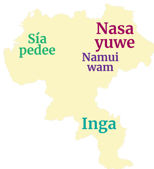
Imagen 4. Lenguas vivas Departamento del Cauca

Estos procesos de clasificación instaurados en el imaginario colectivo se fueron transformando durante el proyecto, inicialmente desde lecturas y talleres previos que se diseñaron para contextualizar el territorio caucano. Fue una tarea de reconocimiento de la riqueza lingüística y cultural que lo caracteriza; su eje, las implicaciones que tiene trabajar con comunidades bilingües que conservan sus lenguas maternas vivas y en uso.