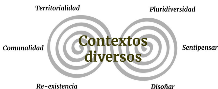
Imagen 2. contextos diversos.

La ruta se centra en el Departamento del Cauca, ubicado en la región del suroccidente colombiano, donde convergen múltiples territorialidades y realidades pluriversas, habitado por diferentes comunidades que reclaman ser respetadas desde un lugar propio, quienes han reconfigurado desde sus luchas y procesos de resistencia y re-existencia , significados y sentidos, en contraste con modelos sistémicos que siguen organizando el mundo a través de paradigmas de comparación estándar.