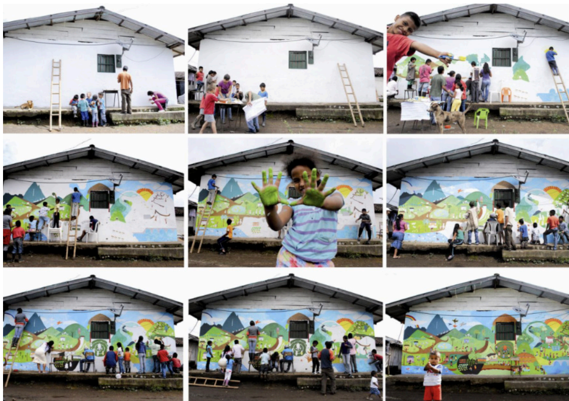
Imagen 8. Proceso grafico mural